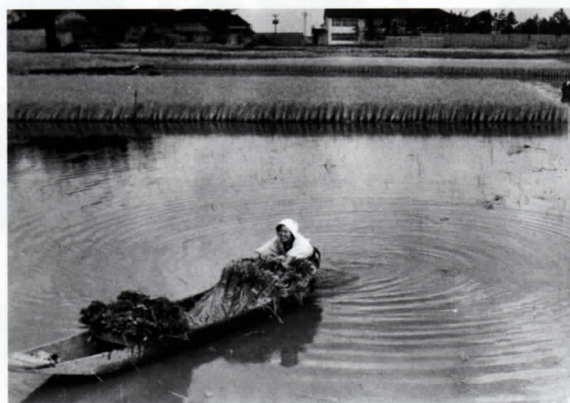
十二町潟周辺の湿田(昭和30年代頃)