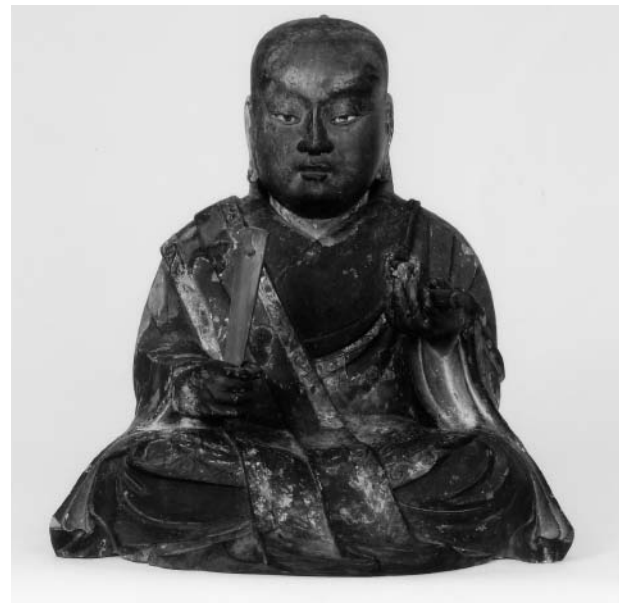
日蓮上人坐像（蓮乗寺蔵）