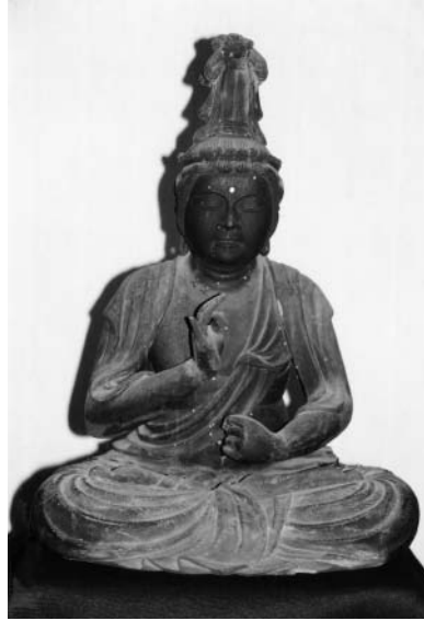
聖観音菩薩坐像（興聖寺蔵）

中世の氷見を知ることは、今の氷見を知ることにつながります。仏像・絵画・石造物・考古資料など、さまざまな文化遺産を通して、中世の氷見を紹介します。