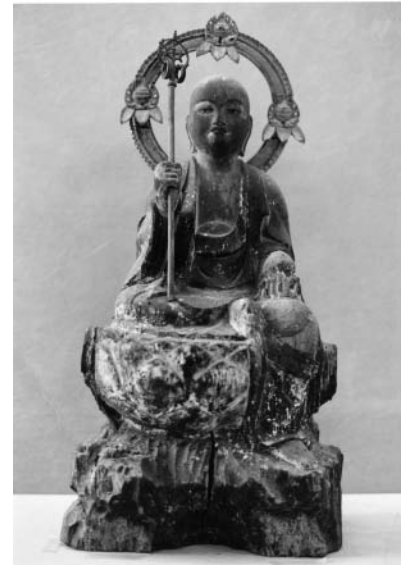
延命地蔵菩薩（餅喰地蔵）坐像 （上日寺蔵）