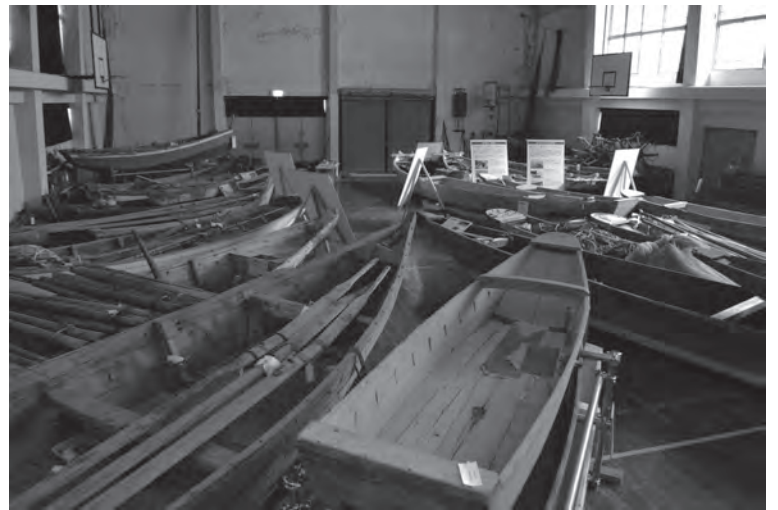
旧体育館の木造船