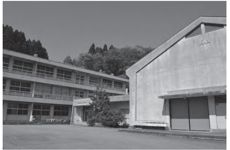
氷見市文化財センター（旧女良小学校）

また旧体育館では、氷見の定置網漁に欠かせない存在だった網取り船ドブネの1/2スケールの復元模型、ドブネと同じく日本海沿岸地域特有の造船技法「オモキ造り」で建造された神通川のササブネと若狭湾のトモボトを収蔵しています。そのほか、富山湾東部の朝日町から西部の氷見市、能登半島外浦にかけての海船、十二町潟や庄川上流の川舟など、地域の生業を支えた多彩な和船を公開しています。