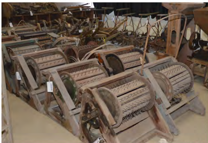
農具 (足踏式脱穀機)

また、農具や生活用具など、さまざまな民具を収蔵展示しており、公開日には学芸員が随時解説を行います。