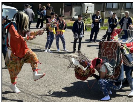
青空の下、笛や太鼓の祭り

獅子舞は、青年団員の減少やコロナ禍で途絶えていましたが、鳥居の再建を機に復活されたそうです。