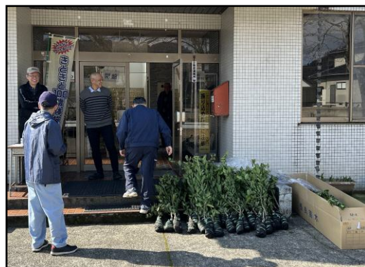
みかん配布(宇波みかんの郷づくり)