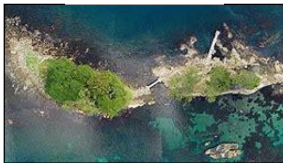
上空から見た蛇が島

また、島の標高は男島で5メートル・女島で4メートルしかなく、雨や波浪によって島の土砂が流出し、陸上植物が危機に見舞われてきました。