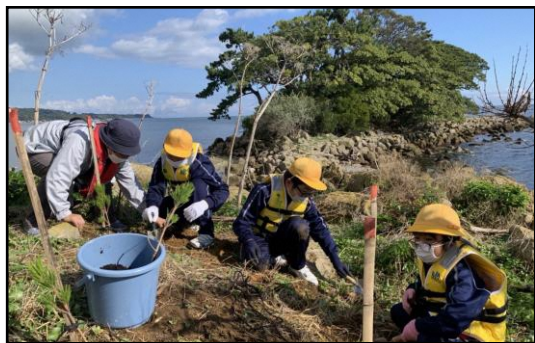
蛇が島の松移植活動