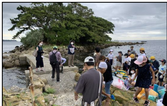
蛇が島の清掃活動

島の陸上植物は、タブノキ、そしてトベラやハマウドなどの暖地性植物、エゾヒナノウスツボ、そしてハマアカザなどの寒地性植物があり、暖地性の植物と寒地性の植物が混在しているたいへん貴重な存在といえます。残念なことに、帰化植物の侵入などで消失したものもあるようです。