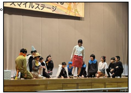
5・6年生オズの魔法使い

ステージ発表では「Nadaura Forever」の合唱後、1～4年生が「The Giant Turnip(おおきなかぶ)」、5・6年生が「オズの魔法使い」を元気いっぱいに発表してくれました。