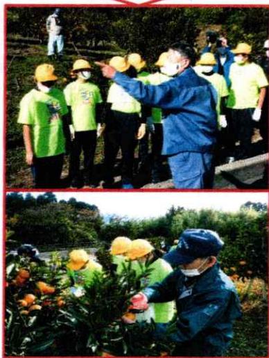
灘浦小学校(於:九殿 浜園地)11月15日