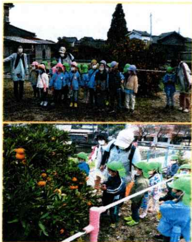
阿尾保育園(於:旧宇波 保育園)11月14日