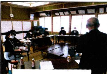
浜野会長の挨拶説明

ランチ会の調理でほかほかのカブス汁をいただきました。ご協力いただいた皆様、ありがとうございました!