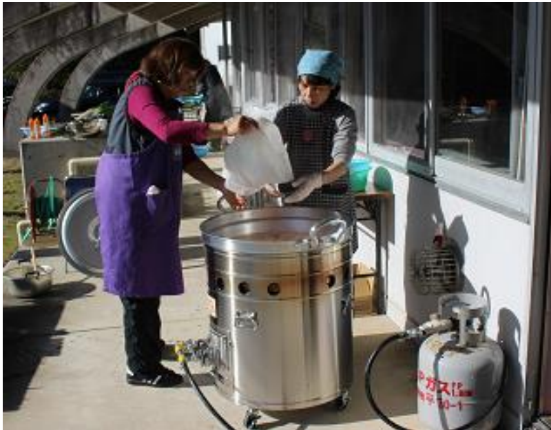
炊き出し訓練の様子