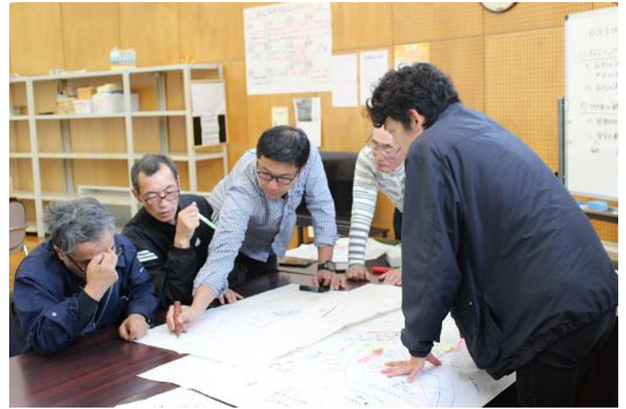
防災マップ確認作業の様子