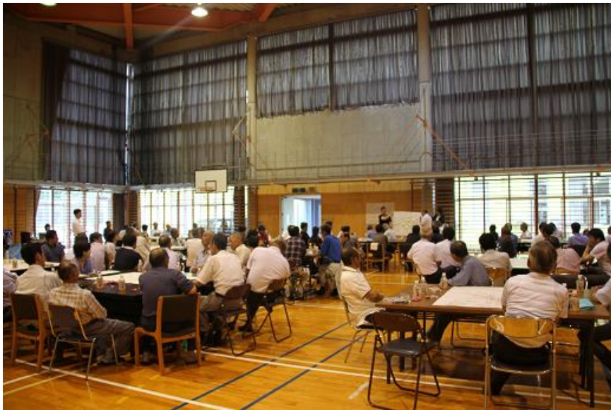
11集落から約100名が参加