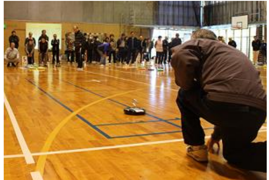
カローリング大会の様子