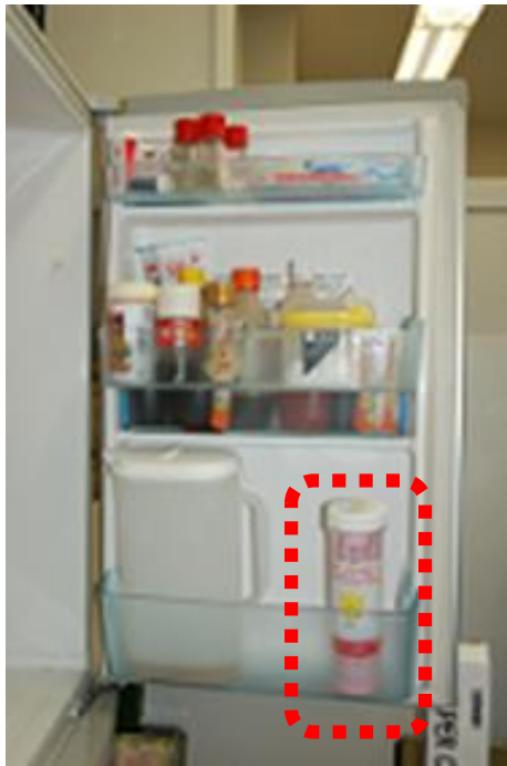
冷蔵庫に設置した 「いのちのバトン」