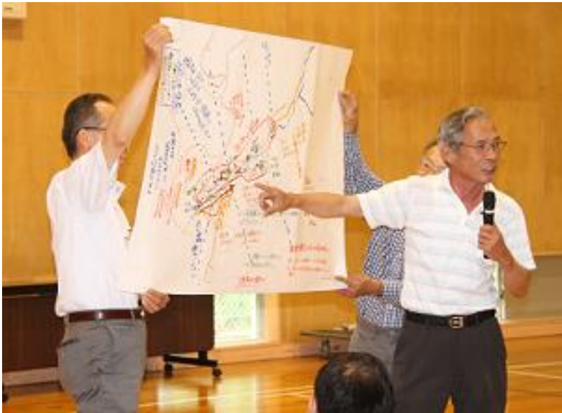
地区住民による発表の様子