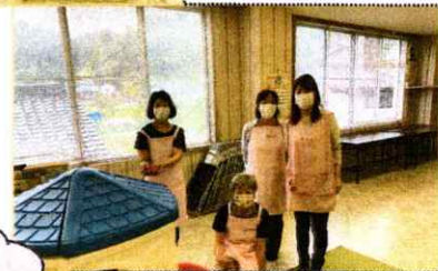
ボランティアの皆さん