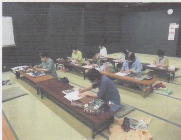
パッチワーク講座風景