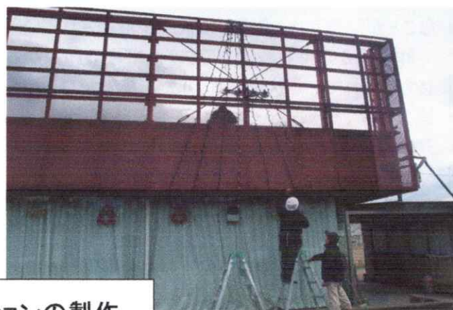
イルミネーションの製作