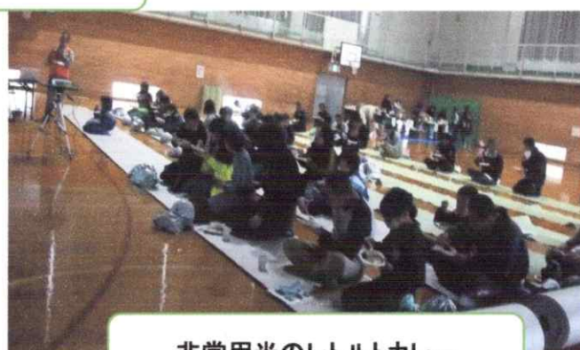
非常用米のレトルトカレー