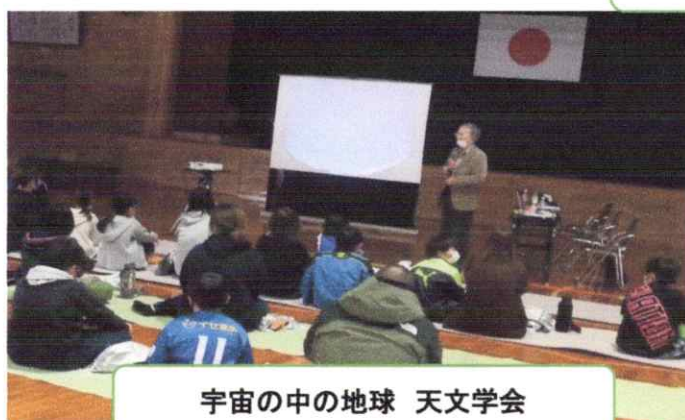
宇宙の中の地球 天文学会