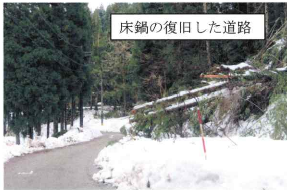
床鍋の復旧した道路

8日(金)から降り続く大雪のために、左義長に使う竹の準備や会場予定の旧速川小学校のグラウンドの除雪も困難となり中止にすることとなった。