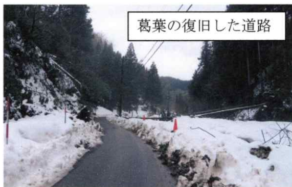
葛葉の復旧した道路