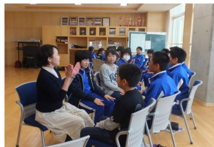
(中学校教員による音楽科の授業)

本委員会では、これまでの実績をしっかりと踏まえ、氷見市ならではの特色ある小中連携教育の在り方について調査・研究を進めていきます。