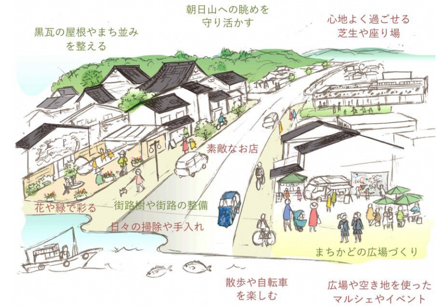
▲国道 415 号沿道における景観まちづくりの考え方