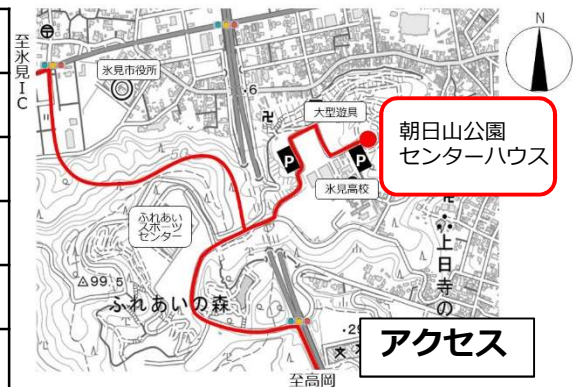
朝日山公園 センターハウス