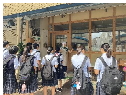
地域協働学習の様子