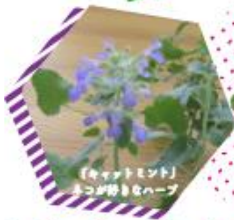
「キャットミント」 よつがかりなハーブ

会場 氷見市海浜植物園 2階ワークショップ 期間中ハーブの花苗の販売もあります。