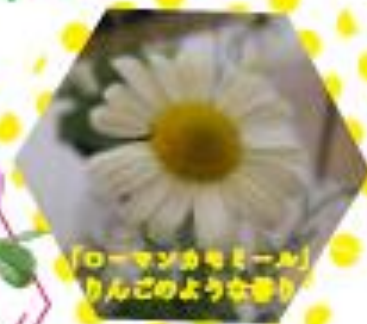
「ローマンカモミール」 りんごのような香り