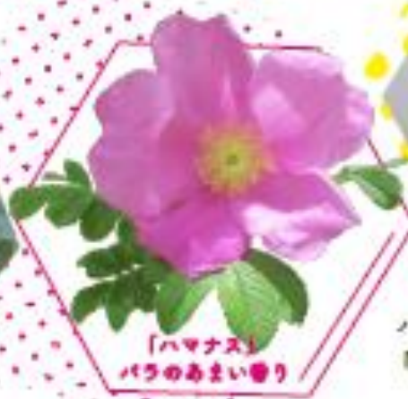
「ハマナス」 バラのあまい香り