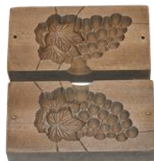
きんかとうきがた ぶどう 金花糖木型「葡萄」