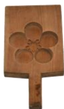
らくがんかしがた うめばちもん 落雁菓子木型「梅鉢紋」