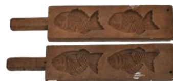
練り切り菓子木型「鯛」