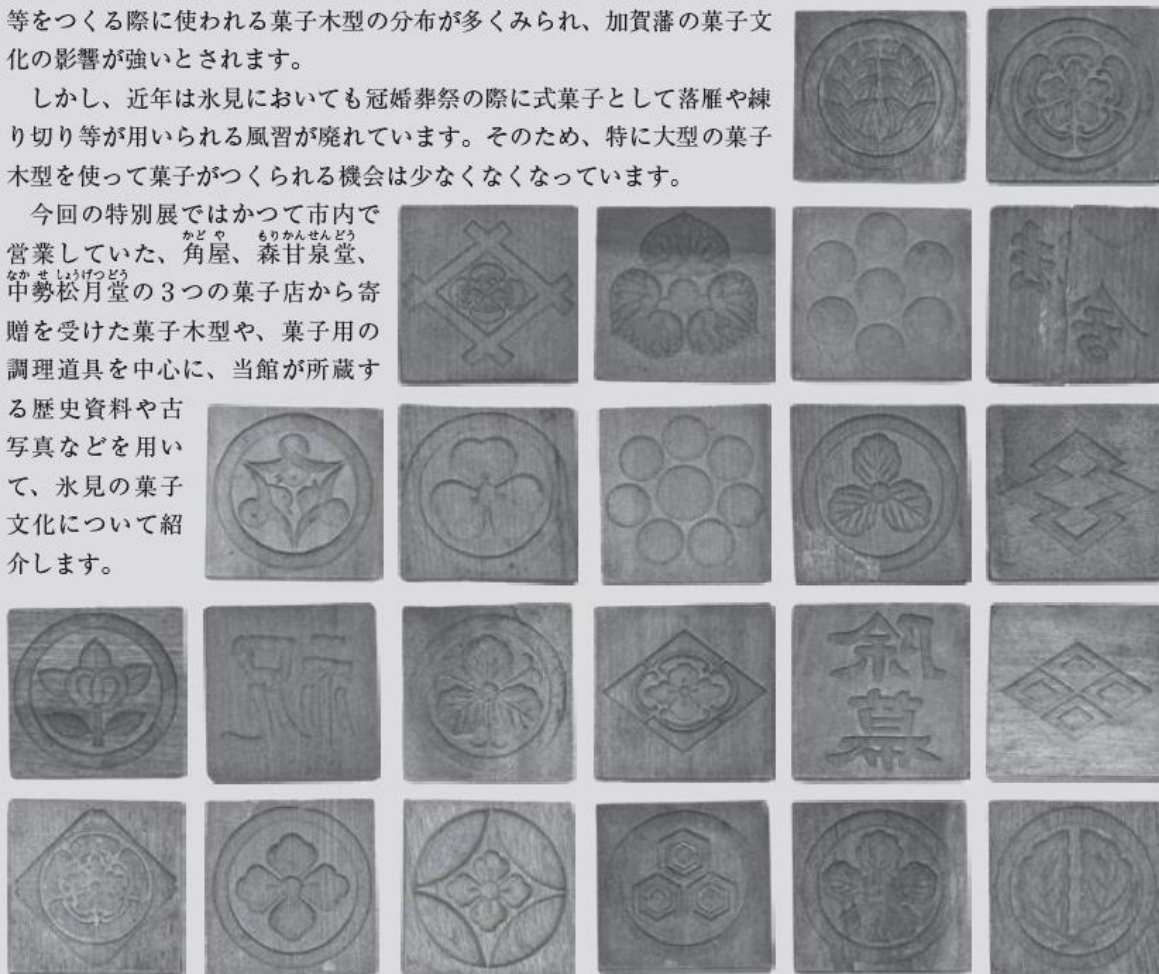
式菓子をつくる際に用いられた家紋や「祝」、「法会」等の文字が刻まれた窓用菓子木型

今回の特別展ではかつて市内で営業していた、角屋、森甘泉堂、中勢松月堂の3つの菓子店から寄贈を受けた菓子木型や、菓子用の調理道具を中心に、当館が所蔵する歴史資料や古写真などを用いて、氷見の菓子文化について紹介します。