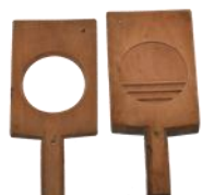
らくがんかしがた 落雁菓子木型