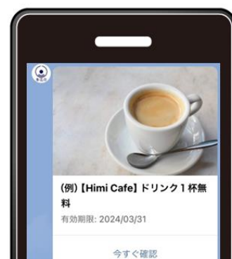
クーポンのイメージ