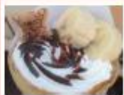
クレープ レイヴル