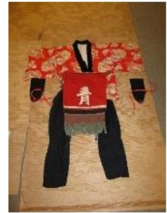
囃子方衣装、鉦、豎笛