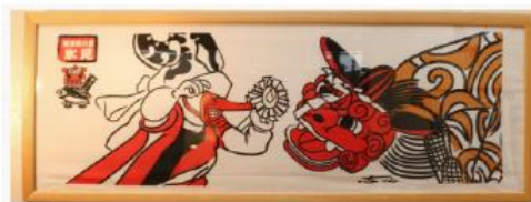
獅子舞手ぬぐい（帆布と手ぬぐいの店なごみ）