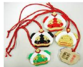
獅子ガチャラ（井波彫刻（協））