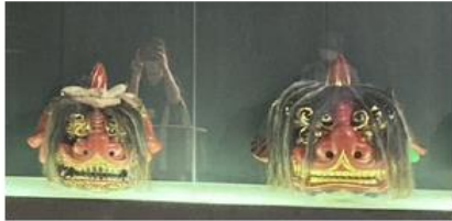
獅子頭、カヤ（胴幕）、しっぽ