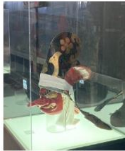
天狗のお面、烏帽子、衣装一式、 天狗の刀、なぎなた、槍、 ザンバラ髪（ズッカブソ）