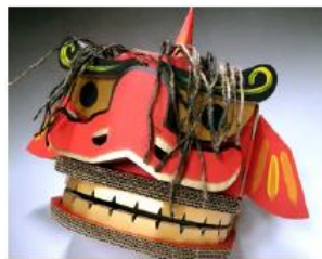
ダン獅子（小島ダンボール）