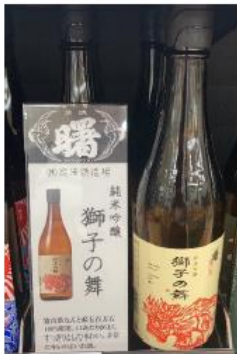
純米吟醸獅子の舞（高澤酒造場）