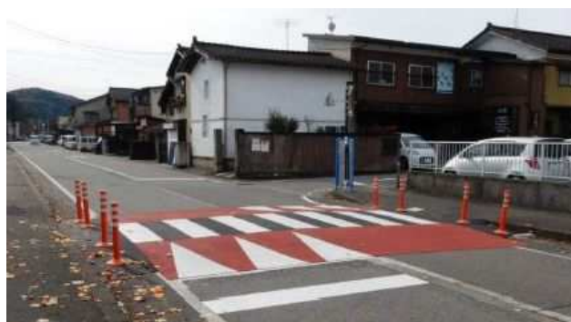
可搬式ハンプ設置イメージ