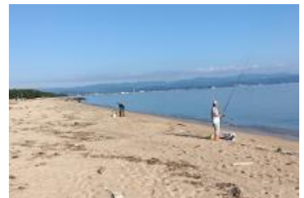
第1回北陸オープンの様子