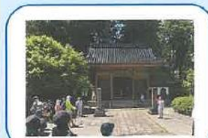
地元住人の案内でツアー開始