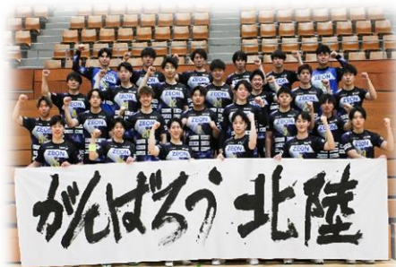
(一般社団法人 富山ドリームス)