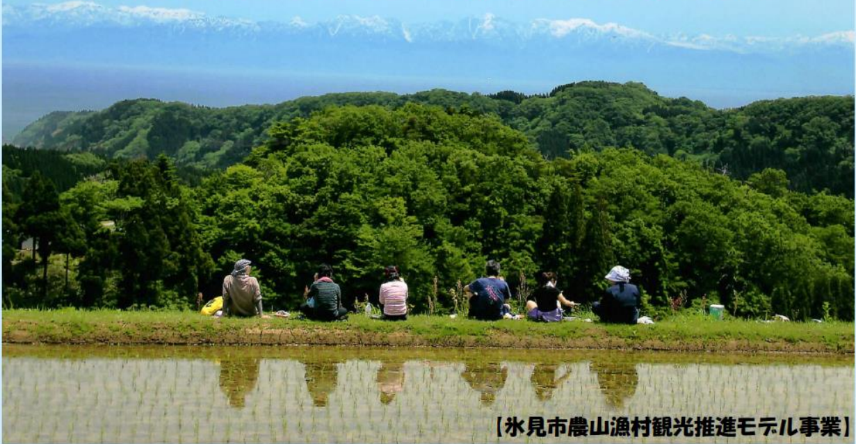
【氷見市農山漁村観光推進モデル事業】