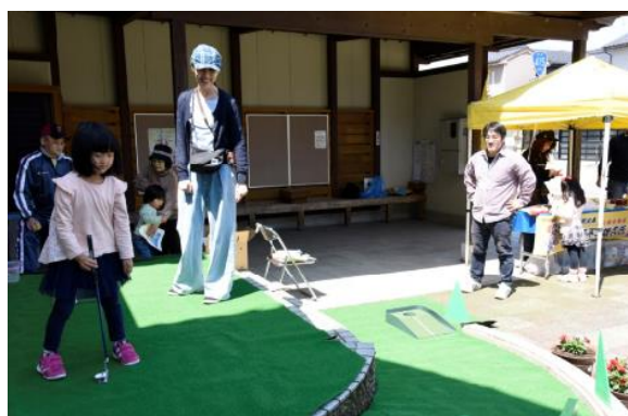
プロゴルファー猿パターゲーム