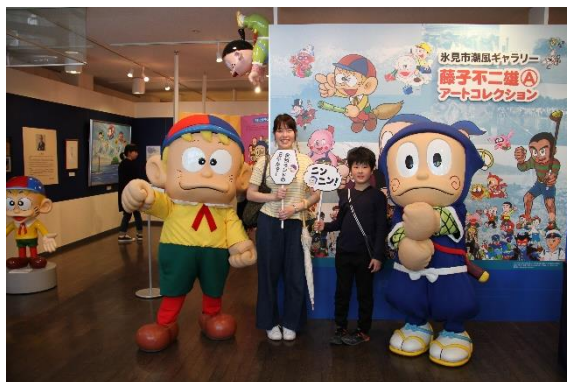
キャラクターグリーティング