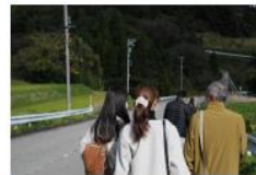
〇〇さんの案内でツアー開始