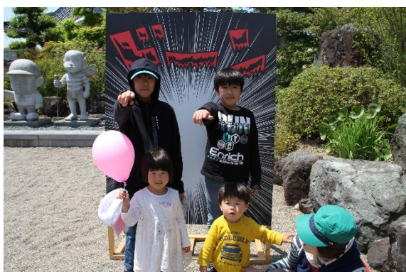
笑ウセえるすまん「ドーン・ドン!!」大会