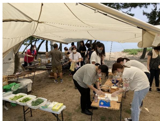
おしゃれキャンプ飯の様子