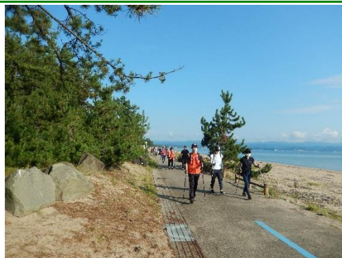
ノルディックウォーキングの様子