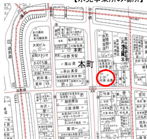
【氷見事業所の場所】