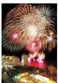
2017年4月2日付 北國新聞朝刊

日時 4月6日(土) 午後8時～ 場所 和倉温泉 湯っ足りパーク(石川県七尾市和倉町ひばり1-1) 問合せ 和倉温泉観光協会 ☎0767-62-1555