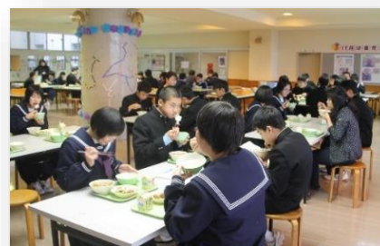
ランチルームでの給食風景