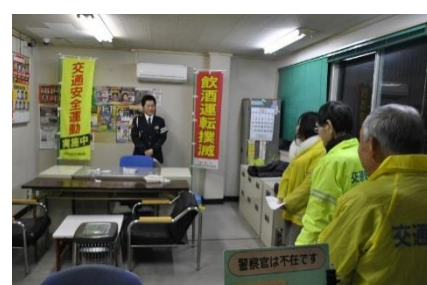
飲酒運転やめさせナイト作戦 (H29.12.15)