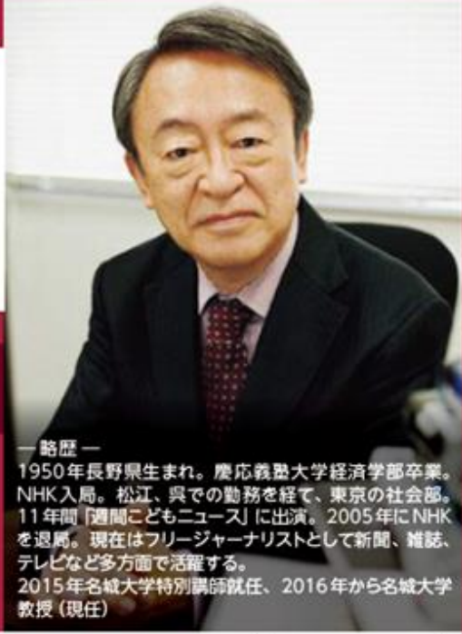
一 略 歴 一 1950年長野県生まれ。慶応義塾大学経済学部卒業。NHK入局。松江、呉での勤務を経て、東京の社会部。11年間「週間こどもニュース」に出演。2005年にNHKを退局。現在はフリージャーナリストとして新聞、雑誌、テレビなど多方面で活躍する。2015年名城大学特別講師就任、2016年から名城大学教授（現任）

日 時 ● 平成31年 1月19日(土) 15:00~17:00 [開場14:30]