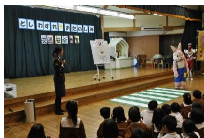
年忘れ・おたのしみ交通安全教室 (H29.12.13)