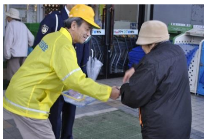
夜間の交通事故防止呼びかけ キャンペーン (H29.12.11)