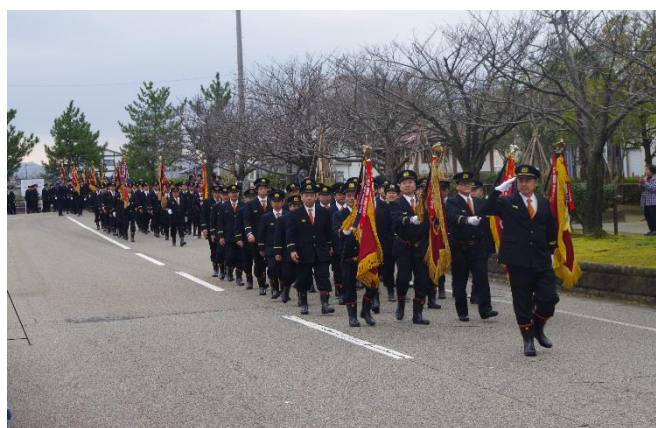
消防出初式分列行進の様子