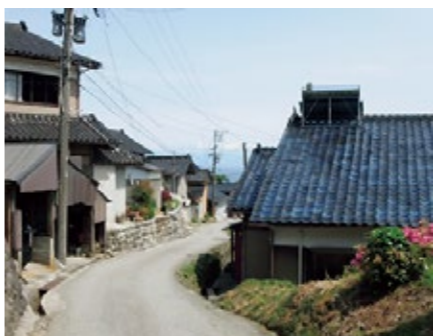
沿岸部集落景観(中田)