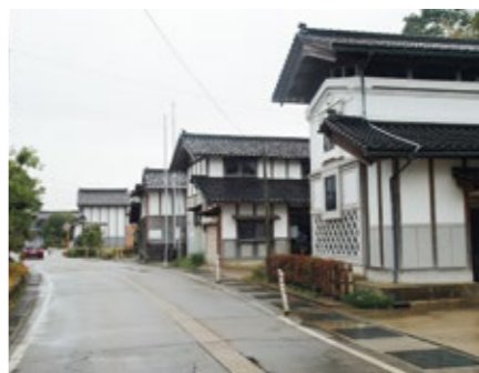
平地集落景観(深原)