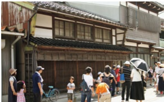
古い街並みが残る今町(平成30年度)