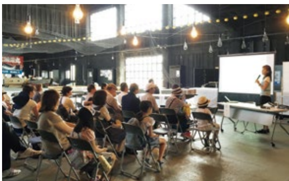
講義風景(平成30年度)