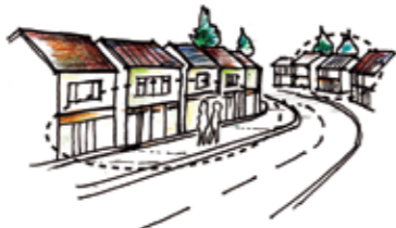
通りに連続する家並み