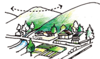
山・里・畑の調和