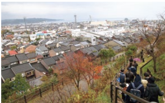
朝日山公園から七軒町への眺望(平成29年度)