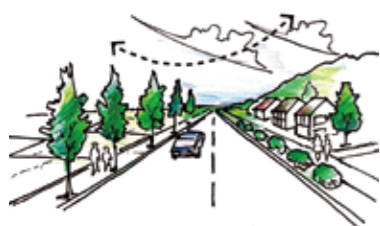
まちを見通す眺望

「氷見らしい景観」を分かりやすく伝えるために、景観特性をパターン(法則)化しました。今後の景観づくりの参考となるものです。