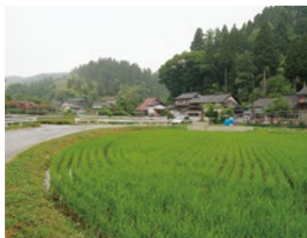
谷筋集落景観(脇之谷内)