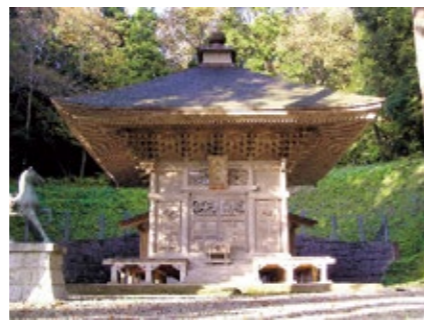
県指定有形文化財の道神社拝殿(中田)

氷見市観光ボランティアガイド養成塾運営委員会 事務局(商工観光課 担当:高橋) ☎74-8106