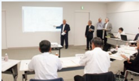
提案発表会の様子

9月12日の第2回提案発表会では、申請した5団体が提案事業を発表しました。5団体への交付が決定し、補助金交付額は合計192万円となりました。提案内容は下表のとおりです。