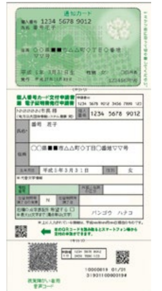
通知カードと 個人番号カード交付申請書