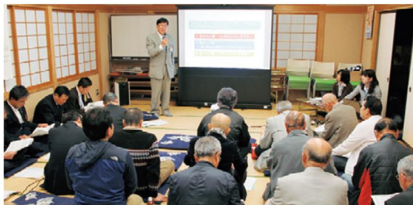
(過去のふれあいトークの様子)

なお、令和4年度からスタートする「第9次氷見市総合計画」の策定に市民の皆様のご意見・ご提言を反映するため、第9次氷見市総合計画市民説明会と合わせて開催いたします。