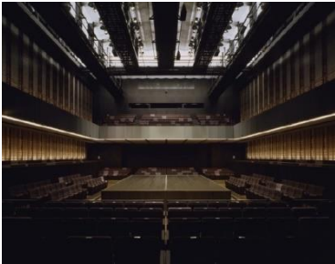
センターステージの例（長野県茅野市民館）

ホール1階席は、 エアキャスター方式による可動式座席 を採用しています。座席をいくつかのブロックに分割し、下面を空気で浮かせることにより、重い座席を小さな力で動かすことができ、 様々な催事が開催可能 になります。