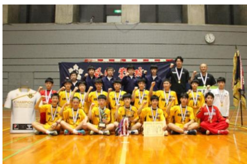
北部中学校男子ハンドボール部