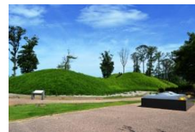
3.かわってきた人々の暮らし