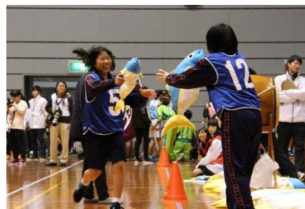
オープニングアトラクションで行われるハンギョボール