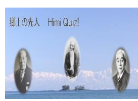
6.郷土の発展につくす