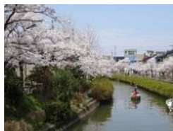
1.わたしたちのまち みんなのまち