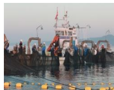
2.働く人とわたしたちの暮らし