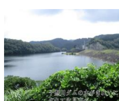
5.住みよいくらしをつくる