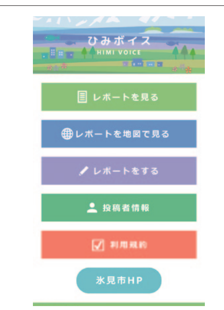
ひみボイスの画面