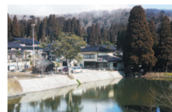
細越ハトムギ生産組合

氷見市農業協同組合は氷見市朝日丘に本所を構え、市内各所に支所を22カ所、支店を1カ所、その他事業所を複数運営しています。職員は現在435名。男女比は、ほぼ半々となっています。