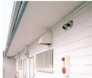
窯業系サイディング