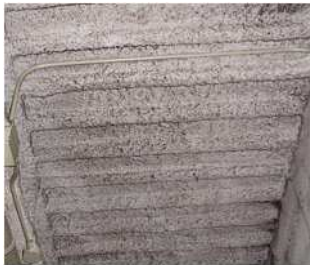
吹付けロックウール