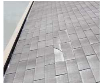
住宅化粧用スレート