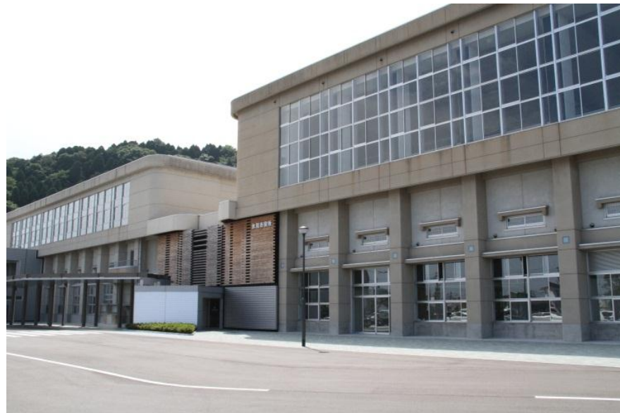
氷見市役所本庁舎 (平成26年5月開庁)