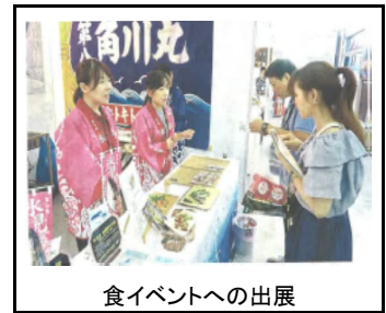
食イベントへの出展