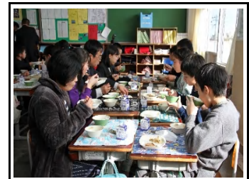
地場産食材を活用した学校