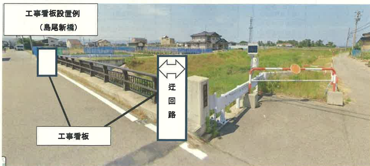
工事看板設置例 (島尾新橋)