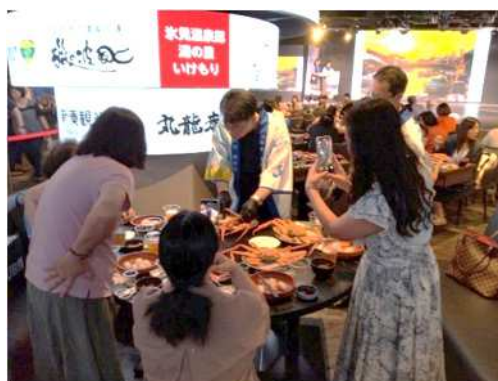
昨年度開催時の様子