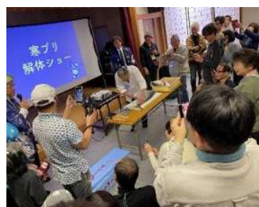
令和6年度ファンクラブ大交流会の様子（飛騨市内）