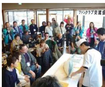
令和5年度ファンクラブ交流会の様子（氷見市内）