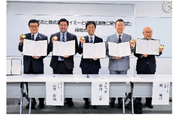
*氷見商工会議所、氷見市農業協同組合、氷見漁業協同組合、氷見市観光協会、氷見市社会福祉協議会

本市と市内5団体*は、「働きたい時間」と「働いてほしい時間」をマッチングするスキマバイトサービスの株式会社タイミーと包括連携協定を締結しました。漁業や農業、観光業など繁忙期が異なる業種を連携させて通年型の仕事を生み出すことで、多様な働き方の促進や新たな働き手の確保につなげるものです。また本市では、市内中小事業者に対し、タイミーなどのスポットワーク仲介サービスを利用する際の手数料の補助を行い、人材確保の後押しを行っていきます。