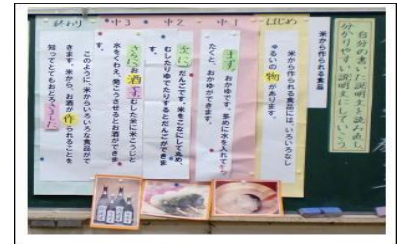
＜色カードによる文章構成の話し合い＞