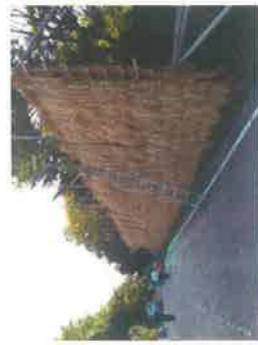
棚田米のハサ掛け