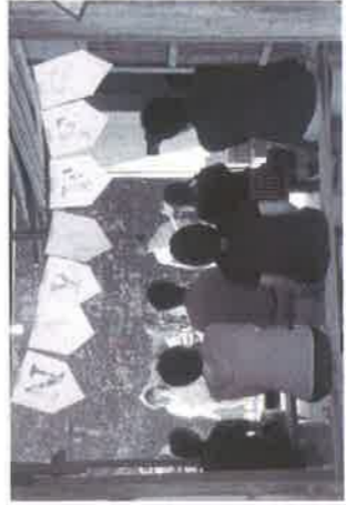
納屋をステージに音楽ライブを開催

藪田ハウスの納屋を活用したちいさなフェス「納屋フェス2016夏」を無事開催することができました。市内出身者、移住者あわせて5組のアーティストがステージで演奏し、楽しい時間を過ごすことができました。短い時間の演奏でしたが、それぞれの個性、人柄が音に現れていて素晴らしかったです。氷見で音楽に関わっている人たちの交流は意外とないということで、核になる場所があればどんどん響きあっていくのではないかと期待が持てました。夜は出演者、観覧者の区別なくバーベキューを味わい、自然と納屋の中で声を合わせて歌うシーンも生まれ、期待していた以上の盛り上がりがありました。協カ隊のメンバーが力をあわせ、また藪田地域の方達の理解とご支援があり、今回の音楽イベントは実現しました。今後もこの納屋が音楽イベントの会場として氷見に財産といえるものに取り組みを進めていきます。