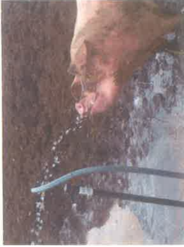
放牧場でおいしいそうに水を飲む豚

氷見の畜産業では氷見牛が有名ですが、これから話題になりそうな「豚」を紹介します。氷見ぶーぶーファームさんの担当の方に案内された山間の耕作放棄地にある飼育現場で非常に驚いたのが、個人差はあると思いますが「臭いがほとんどしないことでした。この時点で既に「何かが違う」と予感しました。そして、一般的な豚舎では考えられないことがたくさん起こっていました。例えば、「走る」とにかく、豚さん走ってます！しかも、山間なのでアップダウンが激しいにも関わらず、走ってます！飼育係の人が呼べば、すたこらさつさと寄ってきて非常に可愛げがありました。冬越しした豚さんは毛もフサフサでした。近くに道路もなく、狭く汚れた豚舎でもなく、よく運動もしてストレスフリーに生活しています。餌も配合飼料の他に、氷見うどんの会社から1週間に2トン出るうどんの端切れの一部を飼料として、また氷見市内の有名農場さんのブドウの搾りかすも餌にされていて、現に目の前で豚さんたちは夢中で氷見うどんを食していました。