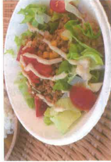
ベジタコライスのそぼろにも使えます