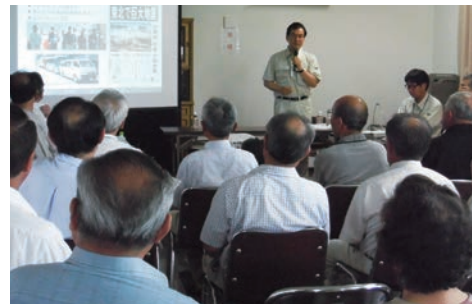
市の将来像や地域の課題等について意見交換する 「市長のまちづくりふれあいトーク」