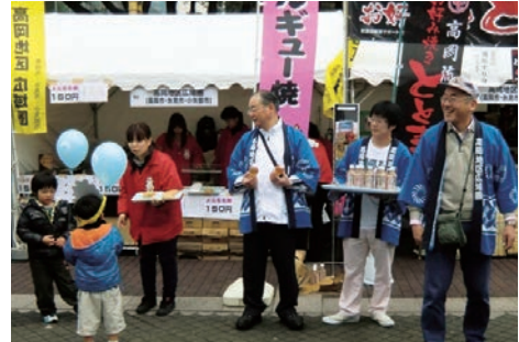
高岡地区広域圏事務組合主催の 大都市圏での3市合同観光PR